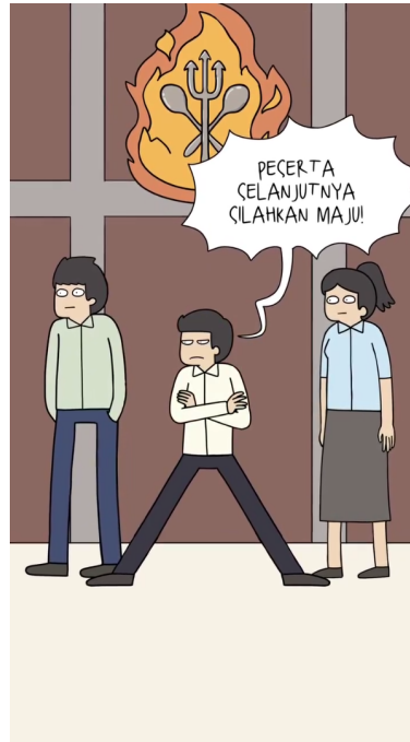
Gambar 1. Scene pertama animasi Tahilalats tahun 2023 Maret minggu ke-5

Animasi tahilalats membuat sebuah konten yang mereka bagikan melalui akun instagram @tahilalats berbentuk panel komik atau animasi di reels ig yang dirilis pada sekitar bulan Maret dan berlatar belakang tentang parodi acara masak memasak.