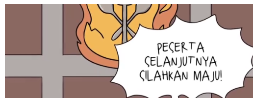
Gambar 2.Screenshot Reels

Scene pertama ini terdapat gelembung text yang bertuliskan “peserta selanjutnya silahkan maju!” text itu bermakna secara harfiah pertama kali dihasilkan menggunakan huruf P - E - S - E - R - T - A maka dari itu bisa dibaca sebagai ‘peserta’ yang artinya seseorang yang ikut serta atau mengambil bagian.