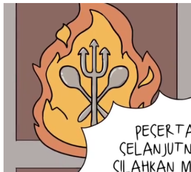
Gambar 4. Screenshot Reels

Pada scene pertama terdapat logo api sendok dan trisula. Api sendiri secara umum melambangkan semangat dan warna merah pada api melambangkan berani. Sendok adalah sebuah alat yang dibuat untuk makan karena bentuknya ada lonjong yang menjorok kedalam. Dan trisula secara harfiah adalah tombak yang memiliki tiga ujung tombak dan mirip seperti alat makan yaitu garpu. Warna silver yang ada pada sendok dan trisula dikarenakan sifatnya yang anti-bakteri.