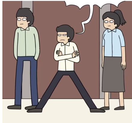
Gambar 11. Screenshot Reels

Dua orang yang berdiri di samping kanan dan kiri dengan tatapan yang tampak tegang menanti jawaban dari kontestan, sedangkan orang ditengah ini memberikan pertanyaan dan menunjukan wajah yang tampak garang daripada dua orang lainnya. Juri selalu menunggu jawaban dari kontestan mengenai apa yang ia masak, jawaban dari kontestan yang tampak membingung ataupun nyeleneh dapat menimbulkan emosi para juri sehingga para juri mulai melontarkan kritikan pedas yang dapat menjatuhkan semangat kontestan.