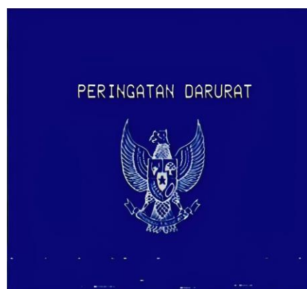
Gambar 1. Peringatan Darurat Garuda Biru

Penelitian ini menunjukkan bahwa unggahan Peringatan Darurat Garuda Biru oleh Najwa Shihab muncul sebagai respons terhadap dinamika politik pasca-Pilpres 2024, dengan isu sentral pencalonan Kaesang Pangarep sebagai calon gubernur. Keputusan Mahkamah Agung untuk mengubah interpretasi batas usia minimal mencerminkan kompleksitas hukum yang dapat memengaruhi legitimasi politik. Unggahan ini tidak hanya menyoroti isu hukum, tetapi juga mengangkat kritik terhadap dinasti politik dan perlunya transparansi dalam pengambilan keputusan politik (Liputan6, 2024).