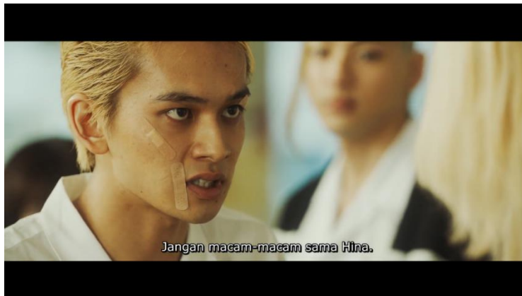
Gambar 5. Film Tokyo Revengers (2021)

Mitos : Sejatinya laki-laki maskulin itu pasti memiliki sifat peduli dengan keadaan kekasihnya dan juga mereka pasti akan khawatir jika tidak mendapatkan kabar orang yang mereka cintai. Perhatian dan peduli termasuk dalam sifat seksual agresif yang ada pada laki-laki (Prabawaningrum, 2019)