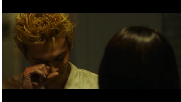
Gambar 3. Film Tokyo Revengers (2021)

Dalam penjelasan konsep maskulinitas Janet Saltzman Chafetz, konsep seksual laki-laki ialah bagaimana seorang laki-laki yang menjalin hubungan dengan perempuan. Konsep seksual dalam scene ini menjelaskan bagaimana cara Takemichi memperlakukan Hinata sebagai kekasihnya.