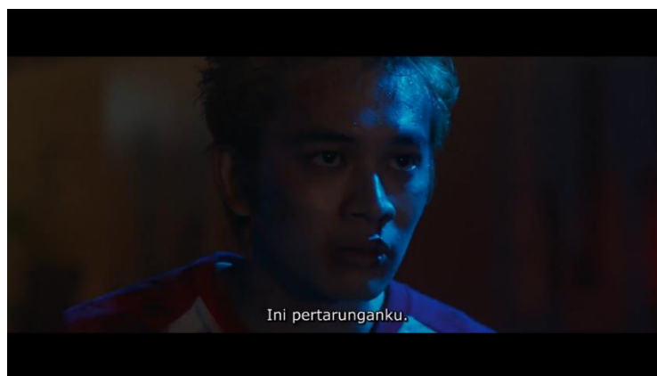
Gambar 9. Film Tokyo Revengers (2021)

Dalam penjelasan konsep maskulinitas Janet Saltzman Chafetz, laki-laki harus bisa bertanggung jawab atas dirinya, disiplin dan mandiri. Di scene ini Takemichi menghadapi perkelahian dan ia bertanggung jawab atas dirinya sendiri tanpa mau merepotkan orang lain.