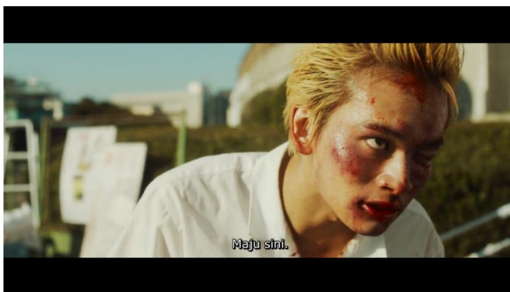
Gambar 11. Film Tokyo Revengers (2021)

Denotasi : Di scene kali ini, penanda yang terdapat dalam potongan gambar diatas ialah seorang pria berambut pirang yang menggunakan baju kemeja berwarna putih dan di wajahnya terdapat luka memar di beberapa bagian seperti di bagian pipi sebelah kanan dan mata sebelah kiri. Di adegan ini juga terdapat dialog yang berkata “ Maju sini ”.