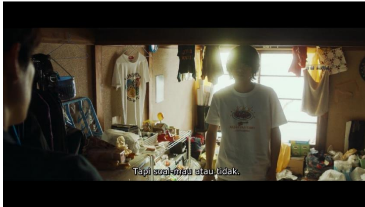
Gambar 10. Film Tokyo Revengers (2021)

Denotasi : Di scene selanjutnya penanda yang muncul dalam potongan gambar diatas ialah didalam ruangan yang penuh dengan barang, terdapat 2 orang pria yang salah satunya menggunakan kaos berwarna putih dan mereka sedang merundingkan suatu hal. Dalam adegan ini juga terdapat penanda berupa dialog yang berbunyi “ Tapi soal mau atau tidak ”.