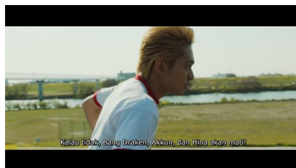
Gambar 8. Film Tokyo Revengers (2021)