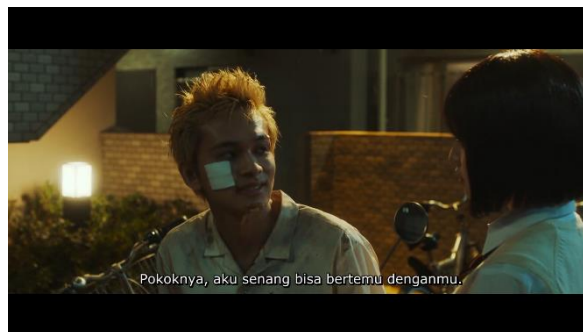
Gambar 4. Film Tokyo Revengers (2021)

Denotasi : Pada gambar selanjutnya penanda yang ada dalam potongan scene ini ialah terdapat seorang wanita yang menggunakan baju kemeja berwarna putih dan seorang pria berambut pirang dengan penampilannya yang lusuh, memakai baju kemeja yang kotor, muka penuh memar dan terdapat perban di pipi sebelah kanannya. Dan disini juga terdapat potongan dialog percakapan yang berbunyi “ Pokoknya, aku senang bisa bertemu denganmu ”.