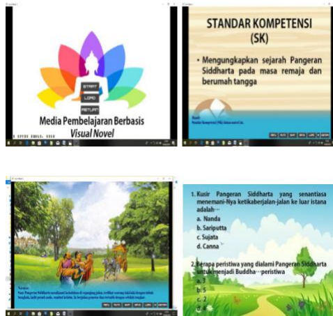
Gambar 1.2 Produk Awal Media Pembelajaran

Novel pada materi Empat Peristiwa Agung. Berikut gambar produk awal media pembelajaran berbasis Visual Novel dengan aplikasi Living Maker 2 pada materi Empat Peristiwa Agung.