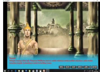
Gambar 1.3 Produk sebelum dan sesudah revisi

yang telah disusun. Penyempurnaan ini dilakukan dengan dasar masukan dan saran dari ahli media serta ahli materi. Pengkajian ulang komponen serta materi ini dilakukan agar media pembelajaran menjadi lebih baik serta ideal untuk digunakan sebagai penunjang hasil belajar peserta didik.