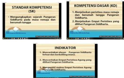
Gambar 1.6 SK, KD dan Indikator ( https://www.template.net/design-templates/backgrounds/powerpoint-backgrounds/ ).

KD (Kompetensi Dasar), dan Indikator yang menyesuaikan materi pembelajaran Empat Peristiwa Agung untuk kelas VII pada jenjang Sekolah Menengah Pertama.