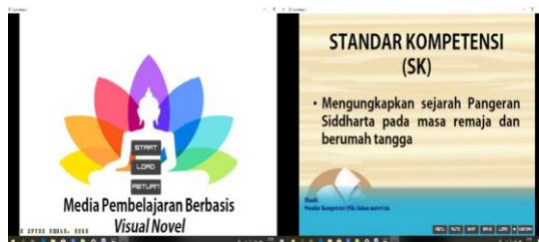
Gambar 1.5 Gambar awalan dan tampilan selanjutnya.

Langkah awal adalah membuat tampilan awal perpaduan background , dan tampilan menu ditengahnya. Tampilan awal terdapat background serta terdapat 3 menu diantaranya: 1) Start, 2) Load, dan 3) Return. Tampilan awal ini merupakan pembuka media pembelajaran yang akan digunakan. selanjutnya ialah menampilkan SK, KD, dan Indikator, lalu tampilan yang narator, kemudian materi, kuis, profil, dan sumber referensi, dimana disamping bawah ada menu-menu yang tertera. Tampilan menu media pembelajaran Empat Peristiwa Agung terdapat tujuh menu, dan masing-masing mempunyai fungsi yang berbeda. Tujuh menu tersebut adalah 1) Menu; 2) Auto; 3) Skip; 4) Save; 5) Load; 6) tanda panah; 7) History.