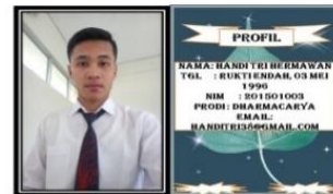
Gambar 1.8 Kuis dan profil media pembelajaran ( https://backgroundcheckall.com/background-kartun-pemandangan-4/ ).

Tahap selanjutnya adalah pengujian ( testing ). Pengujian ( testing ) sangat penting karena pada tahap ini bertujuan untuk mengetahui apakah fungsi-fungsi dalam media pembelajaran Empat Peristiwa Agung dapat berjalan dengan benar dan untuk mengetahui kekurangan atau kesalahan yang harus diperbaiki.