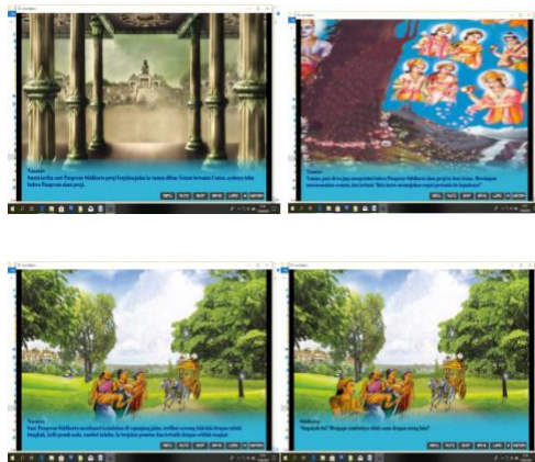
Gambar 1.7 Kumpulan materi Empat Peristiwa Agung ( https://slideplayer.info/slide/13552230 ).

Tampilan yang selanjutnya adalah kuis yang menampilkan pertanyaan-pertanyaan pilihan ganda seputar materi Empat Peristiwa Agung. Kuis berfungsi untuk mengetahui kemampuan siswa dalam menguasai materi Empat Peristiwa Agung yang telah dibahas dalam media pembelajaran ini. Terdapat dua kategori kuis untuk kelas VII yang terdiri dari 10 soal pilihan ganda dan 10 pilihan esai. Tampilan awal kuis yakni pilihan ganda, dimana peserta didik mengerjakannya dibuku tulis masing-masing. Setelah soal pilihan ganda selesai, selanjutnya ialah pilihan esai, yang mana pilihan esai ini, peserta didik mengerjakannya dibuku tulis. Setelah pertanyaan semua selesai dijawab, langkah yang dilakukan ialah mencocokkan jawaban yang tepat dengan guru. Menu keempat adalah menu profil yang menampilkan profil pembuat media pembelajaran Empat Peristiwa Agung dan menampilkan sumber-sumber perolehan gambar, materi, dan suara.