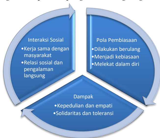
Diagram 2 Pola Penanaman Nilai Kemanusiaan

Proses tersebut diawali dari keterlibatan anggota dalam berbagai kegiatan sosial keagamaan seperti pembagian sembako, pembagian takjil, donor darah, kunjungan ke panti asuhan, serta bantuan kepada masyarakat yang mengalami musibah. Kegiatan tersebut menjadi sarana bagi anggota untuk mengimplementasikan ajaran Buddha dalam kehidupan sosial sekaligus memperoleh pengalaman langsung dalam membantu sesama.