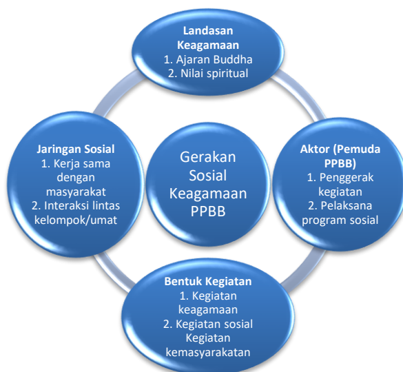
Diagram 1 Hasil dari Bentuk Gerakan Sosial Keagamaan

Bentuk gerakan sosial keagamaan PPBB dapat dipahami melalui teori tindakan sosial Max Weber yang menjelaskan bahwa setiap tindakan individu memiliki makna subjektif dan diarahkan kepada orang lain (Fauzi, 2025). Dalam diagram penelitian terlihat bahwa gerakan sosial keagamaan PPBB berawal dari landasan keagamaan berupa ajaran Buddha dan nilai-nilai spiritual yang kemudian diterjemahkan oleh pemuda PPBB sebagai aktor utama dalam berbagai kegiatan sosial.