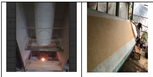
Gambar 9. Pengeringan Kertas Daluang

Pembuatan kertas tradisional Daluang memiliki satu proses yang berbeda jika yang dibuat memiliki ukuran yang besar. Proses pengeringan kertas tradisional Daluang yang memiliki ukuran besar tidak menggunakan batang pohon pisang, melainkan menggunakan papan besar dengan alas kain.