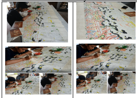
Gambar 13. Proses Penyunggingan selanjutnya

Selanjutnya, dilakukan pewarnaan tambahan dengan warna hijau, biru, dan kuning untuk menciptakan efek gradasi yang memberikan kedalaman dan dimensi pada gambar. Warna biru bisa mencerminkan ketenangan, sedangkan hijau menciptakan nuansa kesejukan alam.