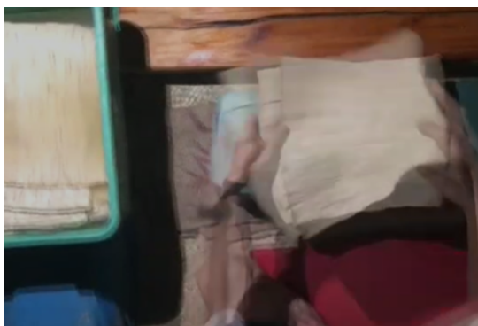
Gambar 6. Perendaman Ulang

Setelah dipukul, kulit daluang kembali direndam untuk melembutkan serat lebih lanjut dan memudahkan proses penyamakan.