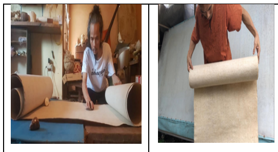
Gambar 10. Kertas Daluang Siap Dikirim

Gulungan kertas kemudian dimasukkan ke kotak khusus yang dilengkapi lampu listrik untuk membantu pengeringan akhir. Setelah itu, permukaan kertas daluang dihaluskan kembali agar siap digunakan untuk proses kalkir dan sungging dalam pembuatan Wayang Beber. Penghalusan ini memastikan permukaan ideal bagi pewarnaan.