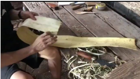
Gambar 3. Pemisahan Lapisan Luar dan Pembersihan Kulit

Kulit yang digunakan, bagian dalam kulit pohon Saeh. Setelah kulit luar dilepas, akan tampak lapisan dalam yang lebih cerah, lembut, dan lentur. Lapisan ini dibersihkan dari sisa-sisa kulit luar menggunakan alat seperti pisau tumpul atau scraper. Proses ini dilakukan untuk memastikan hanya lapisan halus yang digunakan dalam proses berikutnya.