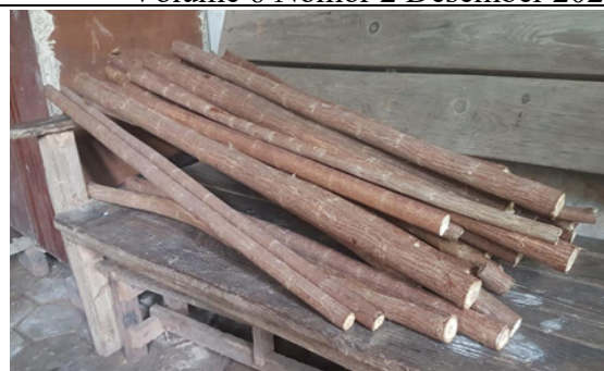
Gambar 1. Potongan pohon Saeh 2 meter

Pohon Zaeh ( Broussonetia papyrifera ) yang sudah ditebang kemudian dipotong menjadi bagian-bagian pendek sesuai kebutuhan. Pemotongan ini bertujuan untuk mempermudah proses pengolahan selanjutnya, seperti pengupasan kulit dan perendaman. Bagian yang digunakan terutama adalah kulit kayunya yang masih segar agar mudah diolah menjadi bahan dasar kertas daluang.