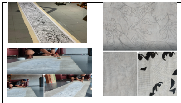
Gambar 12. Kalkir, pelapisan dengan warna dasar, pewarnaan hitam sebagai karakter awal.

. Proses pewarnaan awal sungging menggunakan warna-warna dasar hitam untuk memberikan penguatan pada karakter Wayang Beber Tawangalun. Pewarnaan pertama pada setiap gulungan biasa dilakukan oleh satu penyungging yang dianggap paling menguasai ilmu sungging. Selain dari kalkir lembaran daluang yang telah siap juga dilakukan oleh penyungging yang telah berpengalaman.