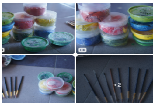
Gambar 11. Bahan dan alat Sungging

memilih gambar dari Museum Nasional Etnografi di Leiden, Belanda (Rijksmuseum voor Volkenkunde), memiliki koleksi wayang beber asli dengan nomor inventaris 360-5256. Lombard (2008) menilai bahwa koleksi tersebut terdiri dari beberapa fragmen yang indah dan bernilai seni tinggi. Alasan Faris Wibisono gambar Wayang Beber dari Leiden mempunyai kemiripan dengan Wayang Beber Tawangalun, Donorojo Pacitan. Gambar tersebut hasil dari gambar digital Wayang Beber yang tersimpan di Museum Leiden Belanda.