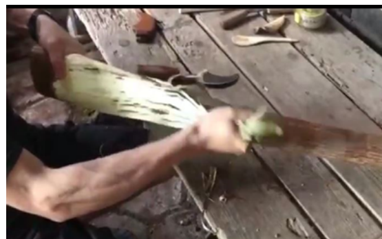
Gambar 2. Pengupasan Kulit

Pohon Saeh yang telah ditebang harus dibersihkan dari kulit bagian luarnya. Kulit kayu dari pohon Saeh atau daluang dikupas secara hati-hati dengan alat sederhana seperti pisau tajam. Pengupasan dilakukan untuk memisahkan bagian luar yang keras dari lapisan dalam yang halus. Proses ini penting karena lapisan dalam kulit kayu merupakan bahan utama pembuatan kertas daluang. Bagian luar yang lebih kasar dan gelap dibuang agar tidak menurunkan kualitas serat. Pengupasan biasanya dimulai dari salah satu ujung batang dan dilakukan perlahan sembari disayat jika diperlukan.