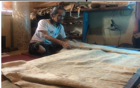
Gambar 8. Penempaan Lanjutan dan Finishing Awal