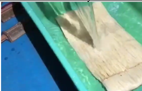
Gambar 5. Pemukulan Serat 1