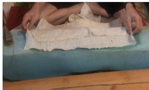
Gambar 7. Penyamakan

merekat. Kulit yang telah bersih ditempa satu per satu untuk membentuk lembaran.