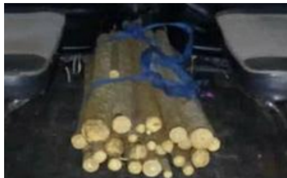
Gambar 1. Pohon Zaeh berusia 4 bulan

Proses pembuatan daluang di yang dilakukan di Tunggilis Bandung dilakukan melalui beberapa tahapan, dimulai dari pengulitan kayu dan penghilangan kulit ari untuk memperoleh bagian tengah kulit yang bersih. Setelah itu, kulit kayu direndam semalam agar menjadi lunak, lalu dilipat menjadi sepertiga panjang aslinya dan dipukul agar melebar. Tiga helai kulit kemudian disatukan dan dipukul kembali untuk membentuk lembaran yang lebih lebar dan menyatu. Setelah proses ini, bahan direndam lagi selama semalam dalam proses yang disebut diseuseuh. Terakhir, bahan dijemur di bawah sinar matahari dengan cara ditempelkan pada batang pohon pisang dan diratakan menggunakan daun ki kandel ( Hoya spec. ), hingga menghasilkan kertas yang halus dan rata (Permadi T, 2005).