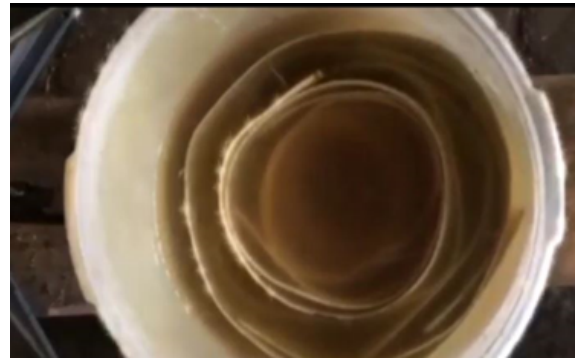
Gambar 4. Perendaman Kulit 24 jam

Kulit daluang yang telah dibersihkan kemudian direndam dalam air bersih. Perendaman ini berfungsi untuk melunakkan tekstur kulit serta mempersiapkan bahan dasar agar lebih mudah ditumbuk dan dibentuk menjadi lembaran. Proses ini dilakukan di wadah tradisional seperti bak atau ember. Kulit kayu bagian dalam yang telah dikupas, direndam selama 24 jam, agar kotoran yang ada pada kulit bagian dalam hilang.