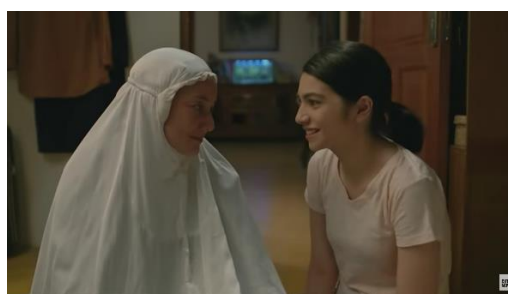
Gambar 2. Episode 10 Menit 18:57