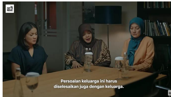
Gambar 1. Episode 9 Menit 25:50