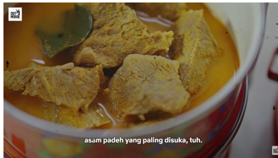
Gambar 4. Episode 1 Menit 16:05