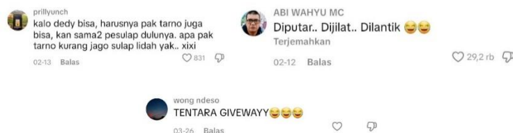
Gambar 13. Ekspresi Dalam Komentar

Komentar di luar konteks langsung pelantikan Deddy Corbuzier berkembang menjadi kritik yang lebih luas terhadap sistem pemerintahan dan kepemimpinan Presiden Prabowo. Pada kategori kritik terhadap sistem pemerintahan, pengguna TikTok mempertanyakan kualitas birokrasi, proses rekrutmen pejabat yang dinilai lebih mengutamakan popularitas daripada kompetensi, serta inkonsistensi kebijakan efisiensi anggaran, sehingga pelantikan Deddy dipandang sebagai simbol problem struktural dalam tata kelola pemerintahan. Sementara itu, pada kategori kritik terhadap kepemimpinan Presiden Prabowo, komentar menyoroti ketidaksesuaian antara wacana penghematan anggaran dan praktik pembagian jabatan, disertai ekspresi emosional seperti kemarahan, kekecewaan, hingga harapan agar kepemimpinan lebih bijak. Fenomena ini menunjukkan bahwa TikTok telah menjadi arena diskursif yang melampaui isu personal Deddy Corbuzier dan berkembang menjadi ruang publik digital untuk menyuarakan ketidakpuasan, kritik sistemik, serta kontestasi makna terhadap kebijakan dan arah kepemimpinan nasional.