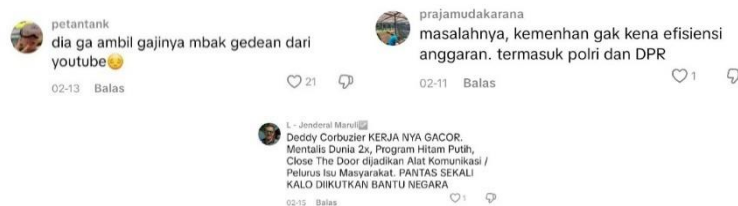
Gambar 10. Komentar Mendukung

Dimensi tindakan dan interaksi terlihat pada polarisasi komentar pro dan kontra, di mana pendukung menilai pengangkatan Deddy sah dan kompeten dalam komunikasi publik, sementara pihak kontra mempertanyakan urgensi dan kompetensinya di tengah efisiensi anggaran; melalui sarkasme, satire, dan simbol digital, pengguna saling merespons secara aktif, menunjukkan TikTok sebagai ruang publik partisipatif yang membentuk makna kolektif serta memperluas perdebatan ke isu legitimasi politik dan prioritas pemerintahan (Firdaus et al., 2024).