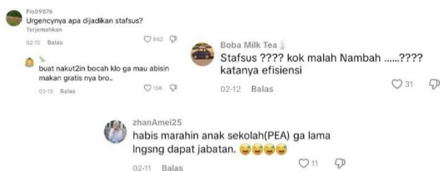
Gambar 11. Komentar Kritik

Komentar mendukung pelantikan Deddy Corbuzier sebagai Stafsus Menhan di TikTok terbagi dalam tiga kategori utama, yaitu penegasan bahwa Deddy tidak mengambil gaji sebagai bentuk pengabdian kepada negara, argumen bahwa pelantikannya tidak bertentangan dengan kebijakan efisiensi anggaran karena belanja pegawai tidak termasuk pos yang dipangkas, serta penilaian bahwa Deddy cerdas dan kredibel dalam bidang komunikasi publik. Pendukung menggunakan pernyataan resmi dan rekam jejak digital Deddy Corbuzier untuk membangun narasi positif, menekankan integritas, profesionalisme, serta kemampuannya menjangkau publik luas sebagai alasan kelayakan. Narasi ini memosisikan Deddy sebagai selebritas politik yang tidak hanya mengandalkan popularitas, tetapi juga dianggap memiliki kompetensi dan kontribusi nyata dalam memodernisasi komunikasi pertahanan, sehingga memperkuat legitimasi pelantikannya di ruang publik digital.