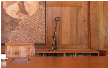
Duplikat Tongkat Kiai Cokro

yang besar dan berpengaruh, menjadi simbol eksistensi dan kekuatan pendukung yang tetap signifikan dalam kontestasi politik, sekaligus pesan simbolik kepada pihak yang berseberangan bahwa ia masih diperhitungkan.