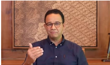
Pengambilan gambar atau angle

sebagai panutan moral dan simbol perjuangan, sejalan dengan nilai humanisme dan keberpihakannya pada rakyat kecil.